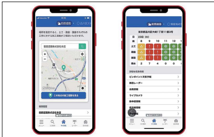
施工指数の画面表示例（土工、路盤、舗装）